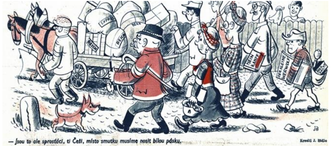
— Jsou to ale sprostáci, ti Češi, místo smutku musíme nosit bílou pásku.