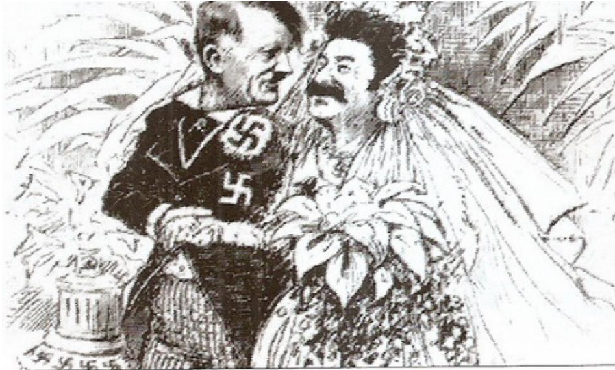
«Брак по расчету». Английская карикатура на Пакт о ненападении